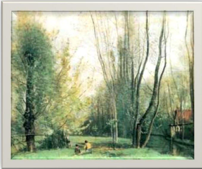
К. Коро «Утро в окрестностях Бове». 1865г.

По-настоящему открыли пленэрную живопись французские импрессионисты (К. Моне, К. Писсарро, А. Сислей и др.). В 1891 г. К. Моне вступает на пленэре в соревнование с природой. Он создаёт серию «Тополя» на берегу реки Эпт, работая одновременно на нескольких мольбертах, стремясь запечатлеть оттенки цвета и освещения, непрерывно меняющиеся в зависимости от времени суток и